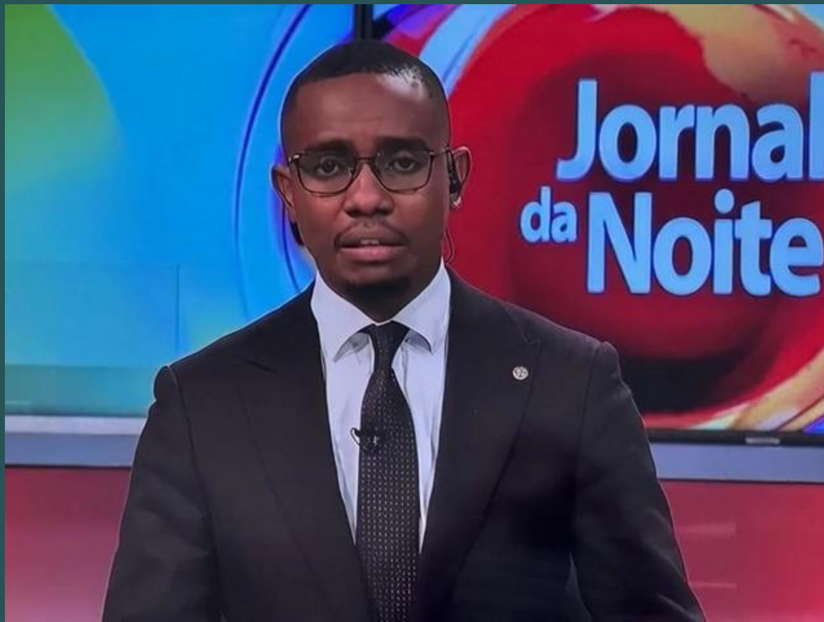
VÍDEO GERADO POR IA - Grok

Ainda que este video pareça inofensivo, não é um video verdadeiro.